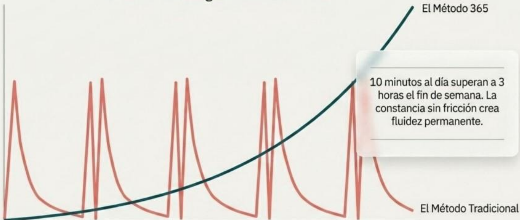
The Micro-Learning Accumulation Curve